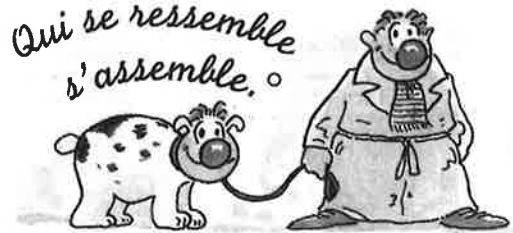
Birds of a feather flock together.